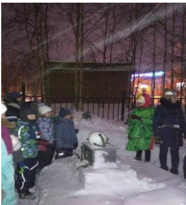
Ребята получают задания от Ёлочки

В конце праздника каждый ребенок получил маленький подарок от Деда Мороза и Снегурочки.